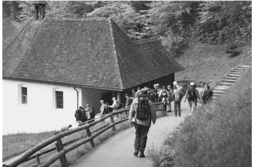
Die Wallfahrt zu Bruder Klaus lebt. Neben den langjährigen Verehrern und Verehrerinnen von Bruder Klaus und Dorothea kommen neue Gruppen und entdecken sie als anregende und hilfreiche Wegbegleiter.