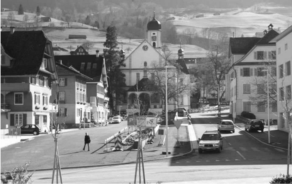
Drei Elemente prägen den neuen Sachseler Dorfkern. Links der neue Dorfplatz, in der Mitte der Dorfbrunnen und rechts die Dorfstrasse.

Am 15. August 1997 ist das Dorf Sachseln von einem schweren Unwetter heimgesucht worden. Zum Schutz der Wohngebiete vor künftigen Überflutungen wurden umfangreiche Sicherheitsmassnahmen realisiert und der Dorfbach wurde in ein südlich des Dorfkerns erstelltes neues Bachgerinne umgeleitet. Diese Massnahmen haben sich bei den sehr starken Regenfällen im August 2005 bestens bewährt.