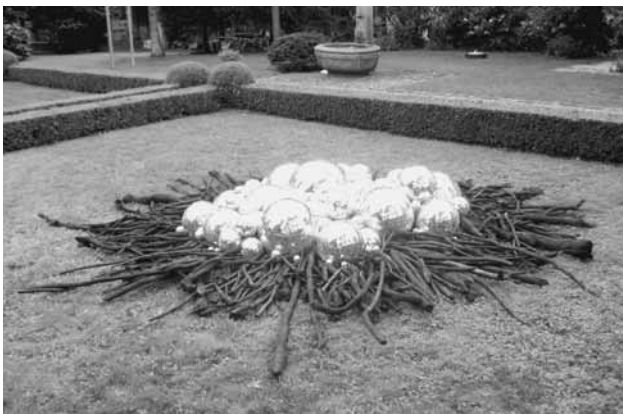
Isabelle Krieg zeigt ihre Objekte und Installationen im Garten und im Museum.

Das Museum Bruder Klaus an der Dorfstrasse 4 ist bis Allerheiligen geöffnet von Dienstag bis Sonntag jeweils von 09.30-12.00 und 14.00-17.00 Uhr. Öffentliche Führungen durch die Ausstellung « ein siedel ei » finden am Mittwoch, 20. September und Mittwoch, 18. Oktober um 19.00 Uhr statt.