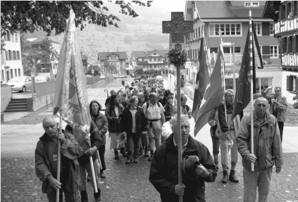
Die Einzüge der Pilgergruppen, auf unserem Bild die 29. Fusswallfahrt der Katholischen Landvolkbewegung Augsburg am 3. August, profitieren vom grosszügigen Dorfplatz.

Neun Jahre und zehn Tage nach der Unwetter-Schreckensnacht vom 15. August 1997 konnte die Sachslener Bevölkerung das neu gestaltete Dorfzentrum mit einem grossen Volksfest einweihen. Sie hatte allen Grund zum Feiern, denn nach den schweren Verwüstungen wurde mit der Verlegung des Dorfbaches die unmittelbare Bedrohung aus dem Weg geräumt und die Chance zu einer nachhaltigen Veränderung des Dorfkerns gut genutzt.