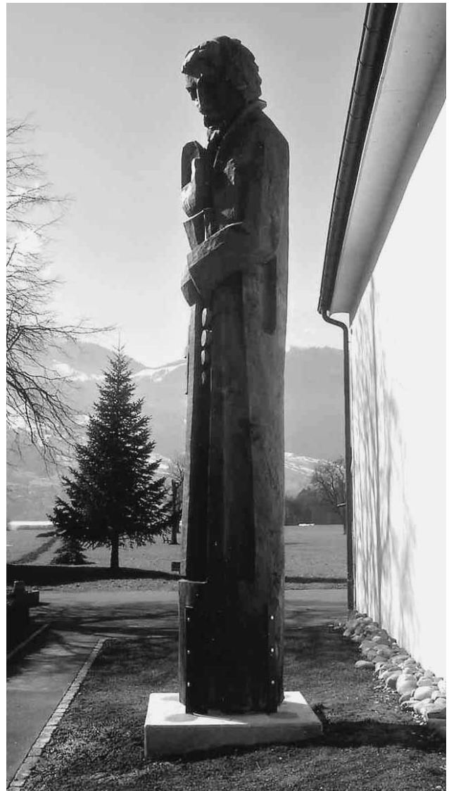
Bruder Klaus, der wie in der Statue in Steinen SZ mahnt und segnet – beides ist bei den Spannungen in der heutigen Kirche nötig.

Bei der Kapelle des Alterszentrums Au in Steinen SZ in der Nähe des Lauerzer Sees erhebt sich eine über 5 m hohe Holzstatue von Bruder Klaus. Sein Blick ist ernst und gütig zugleich; die eine Hand trägt das «Bättli», die andere ist erhoben zum Segnen oder zum Mahnen. Der Stamm aus dem Baumbestand eines ehemaligen Patrizierhauses wurde vom Bildhauer Josef Schibig entdeckt und bearbeitet. Eine Interessengruppe und der Kulturverein Steinen waren fasziniert von der Gestalt des Bruder Klaus, ermöglichten den Ankauf und kümmerten sich um einen optimalen Standort. Am Samstag, 25. März 2006 fand unter reger Beteiligung der Bevölkerung die Einsegnung statt.