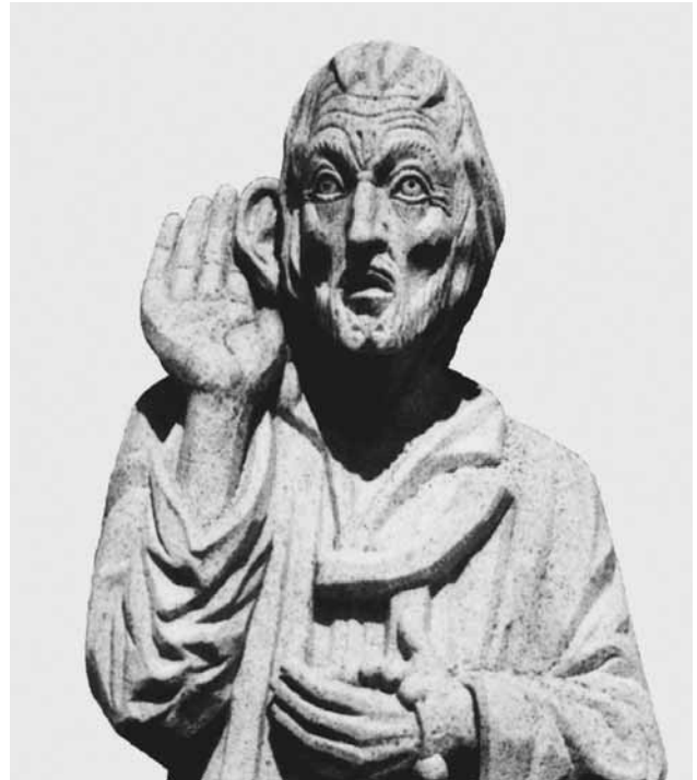
Bruder Klaus horchte lebenslang auf die vielfältigen Zeichen Gottes und suchte ihnen zu gehorchen. Eine Darstellung in der Landvolkhochschule Niederalteich (D) zeigt ihn horchend, mit einer Hand am Ohr.

Eine Statue in der Landvolkhochschule Niederalteich zeigt Bruder Klaus mit der Hand am Ohr. So erlebten ihn die Besucher im Ranft. Ein Horchender war er schon vorher. Horchen und Gehorchen gehörten zu seiner Grundhaltung. Lebenslang horchte er auf die vielfältigen Zeichen Gottes und suchte ihnen zu gehorchen. Gott führte ihn nicht