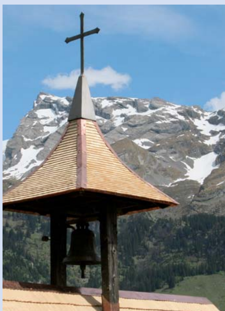
Petite cloche de la chapelle de montagne sur l'alpe «Chlisterli» qui fut construite au 18 e siècle. A cet endroit, Nicolas de Flue se cacha en automne 1467 avant que quatre lumières ne lui indiquent le chemin vers le Ranft.