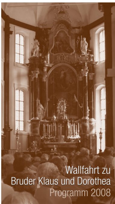
Wallfahrt zu Bruder Klaus und Dorothea Programm 2008